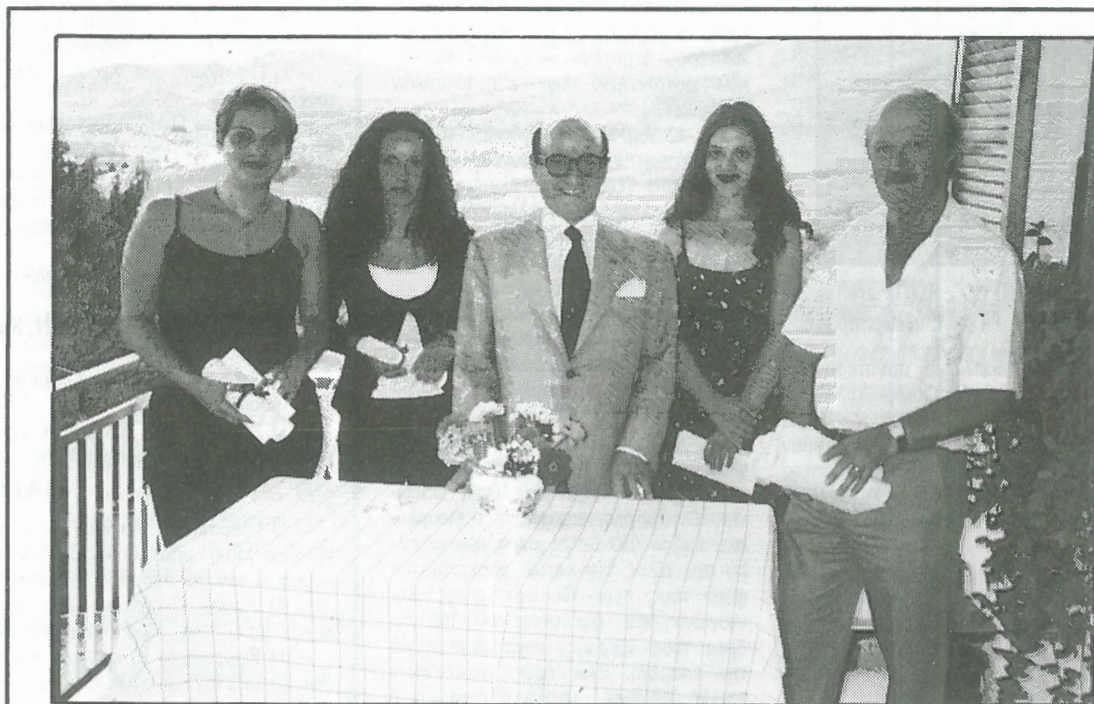
Φωτογραφία από τις Πολιτιστικές Εκδηλώσεις «Καλοκαίρι 97»

Είναι στο χέρι μας αυτό και μπορούμε με τη δική σας συμπαράσταση να πετύχουμε τους στόχους που βάζουμε για τη νέα 10ετία και οι οποίοι θα εγκριθούν με τη δική σας παρουσία στις πανηγυρικές εκδηλώσεις «Καλοκαίρι '98» που θα